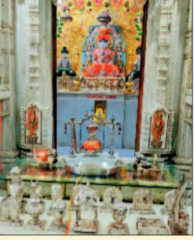
दिन में भक्त करेंगे पूजा का विधान, बनेंगे लाभार्थी